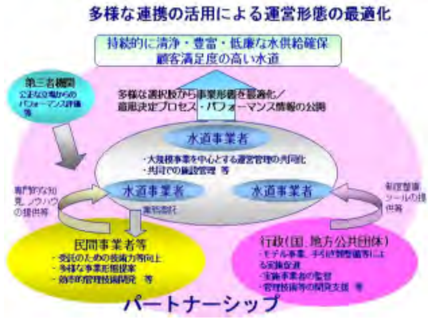
図6-4 多様な連携の活用による運営形態の最適化アクションプログラム