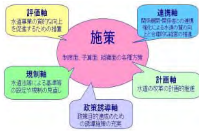
図6-1 各種方策の連携の概念図