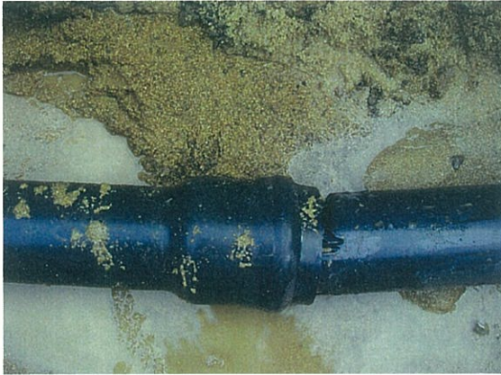
写真 4.3 呼び径 100 硬質塩化 ビニル管 (RR) の継手 抜けによる漏水