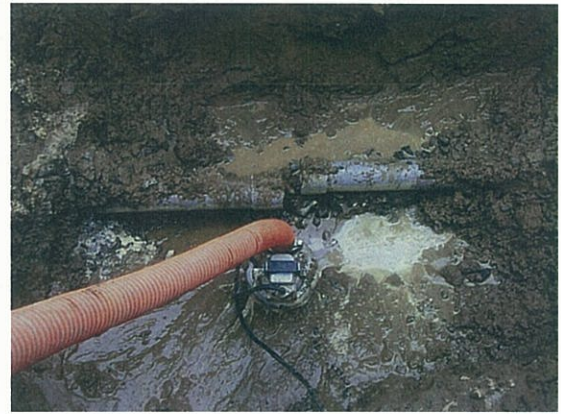
写真 4.4 呼び径 75 硬質塩化 ビニル管 (TS 継手) の 継手破損