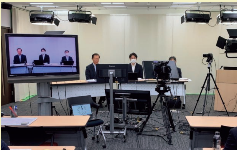
自治体職員向けのオンライン緊急研修