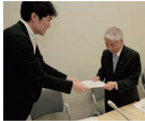
写真：自殺総合対策の更なる推進を求める院内集会

これを受けて、国会においても、同年6月2日、参議院厚生労働委員会において自殺総合対策等をテーマとした審議が行われ、「自殺総合対策の更なる推進を求める決議」が全会一致で可決された。決議においては、我が国の自殺問題について、非常事態はいまだ続いており、決して楽観できないとの認識を示した上で、自殺対策基本法の施行から来年で十年の節目を迎えるに当たり、政府に対し、自殺問題に関する総合的な対策の更なる推進を求めるとともに、立法府の責任において、自殺対策基本法の改正等の法整備に取り組む決意である。