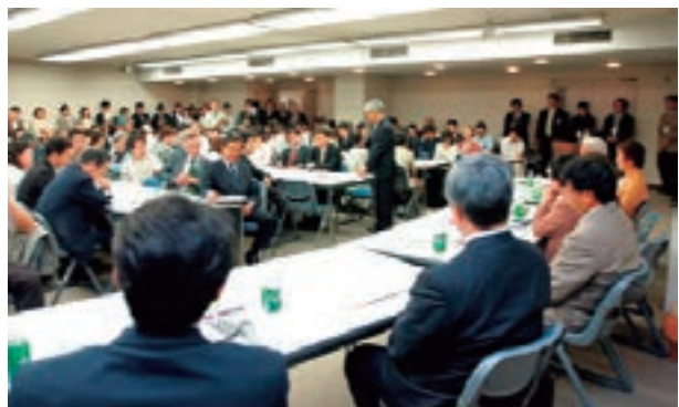
平成17年5月参議院議員会館におけるシンポジウム

このような状況の下、自殺者の遺族や自殺予防活動、遺族支援に取り組んでいる民間団体から、「個人だけでなく社会を対象とした自殺対