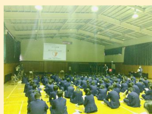
昨年度の介護の未来案内人の出張授業の様子