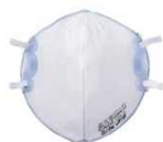
使い捨て式防じんマスク ※ ※ 国家検定合格品を使用してください。