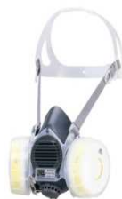
取替え式防じんマスク ※