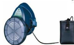
電動ファン付き呼吸用保護具 ※