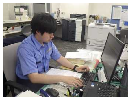
コンピュータシステムによる届出審査

令和4年度の輸入届出は、件数で2,400,309件、重量で約3,192万トンであった。輸入届出のうち、202,671件に対して検査を実施し、このうち781件（延べ825件）に法違反が確認され、積み戻し