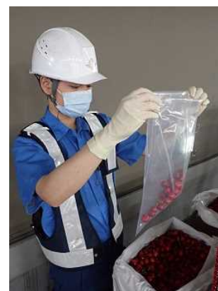
保税倉庫での検体採取

令和4年度は51,148件（計画件数延べ100,021件に対し100,947件（実施率：約101%））を実施し、このうち156件（延べ158件）に法違反が確認され（ 表2 ）、回収、廃棄等の措置を講じた。