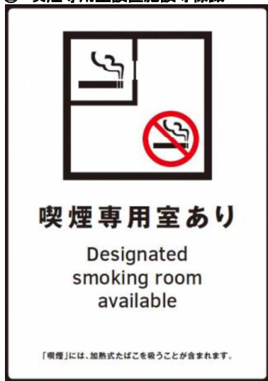
② 喫煙専用室設置施設等標識