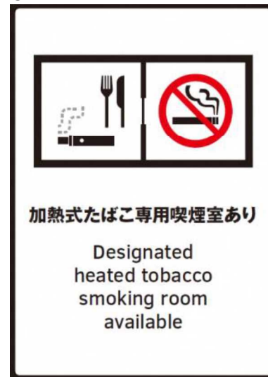
④ 加熱式たばこ専用喫煙室設置施設等標識