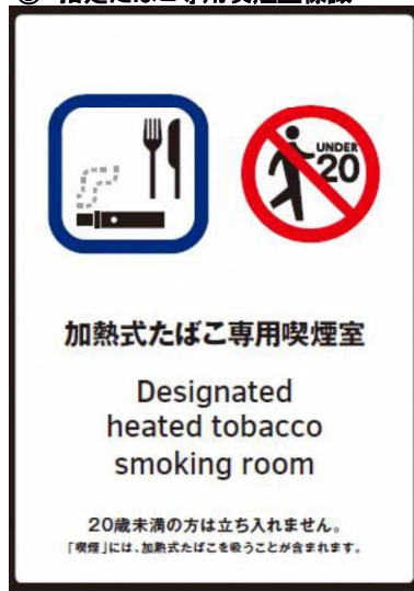
③ 加熱式たばこ専用喫煙室標識