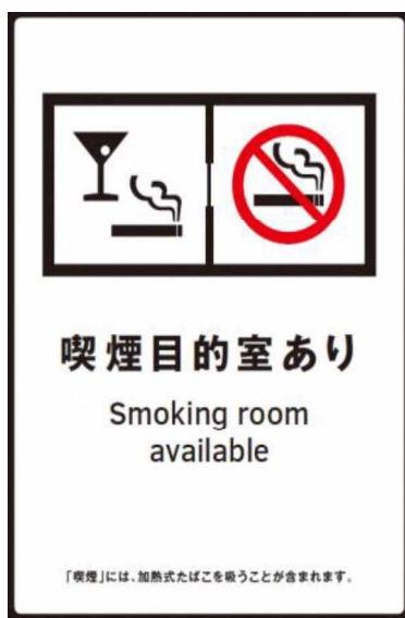
⑥ 喫煙目的室設置施設等標識