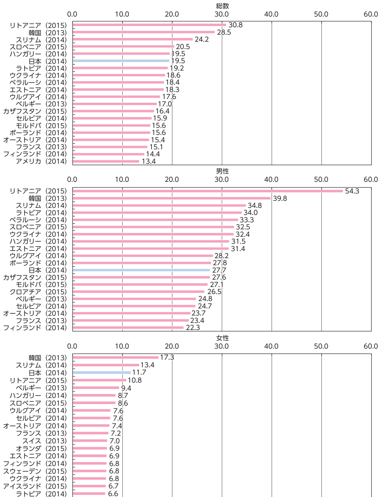
第1-39図 諸外国の自殺死亡率（参考）

注) 世界保健機関の「WHO死亡データベース」から、2013年以降の人口と自殺者数が掲載されている国を対象に自殺死亡率を算出し、上位20か国を表示している。