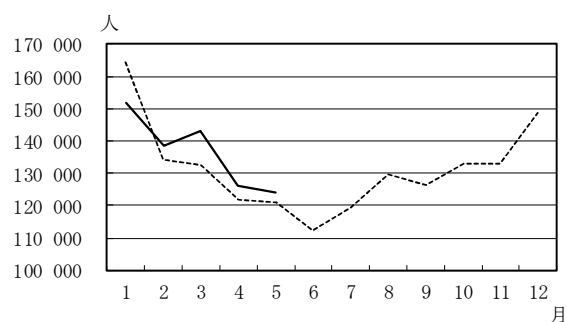
死亡数の前年同月比較