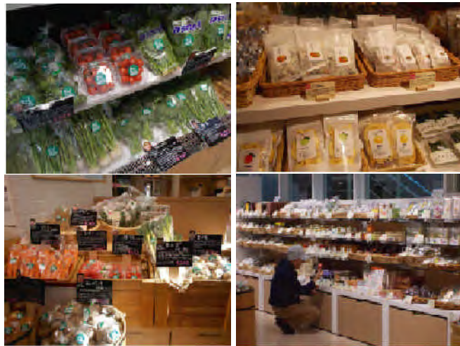
野菜・果物・米・加工品・日本酒・伝統工芸品など240品目を販売。商品を実際に調理して試食できるコーナーも設置。