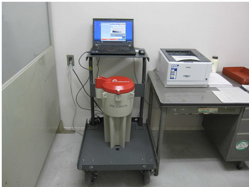
フタをして20～30分間計測