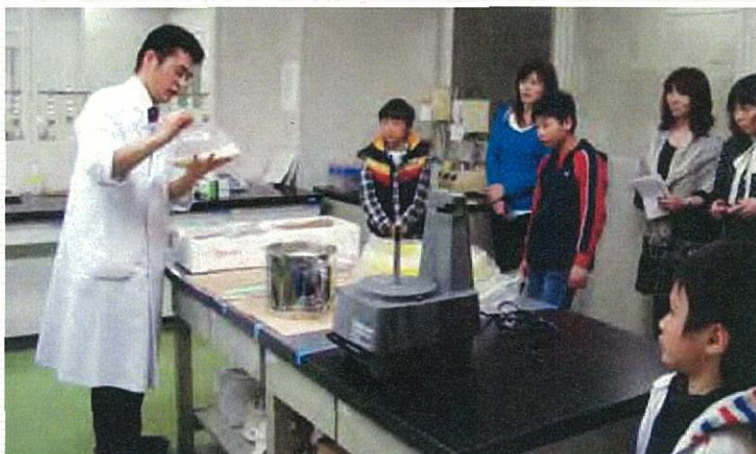
福島県の親子が日本生協連の検査センター訪問