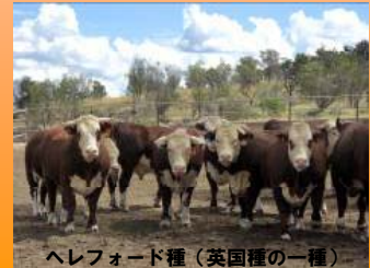
ヘレフォード種(英国種の一つ)