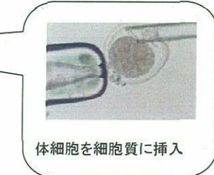
図は「クローンって何? (科学技術庁)」より引用 写真は「クローン牛について知っていますか? 早わかりQ&A集(農林水産省農林水産技術会議・生産局作成)」より引用