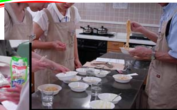
テストキッチン/官能検査