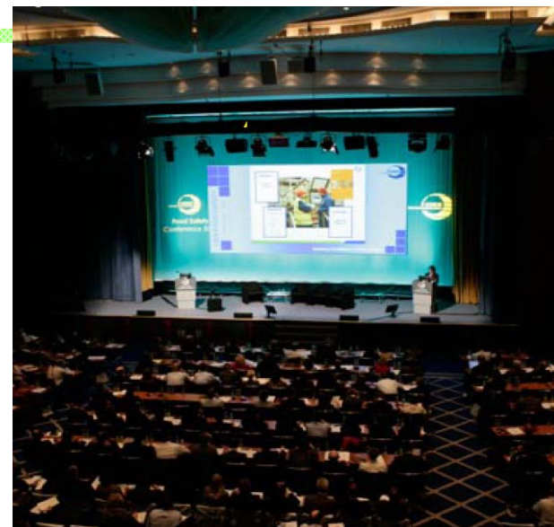
CIES International Food Safety Conference 2007