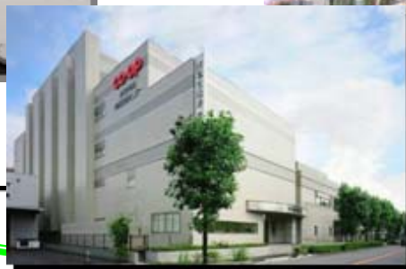
商品検査センター