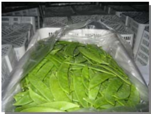
生鮮キヌサヤ (フルシラゾール)