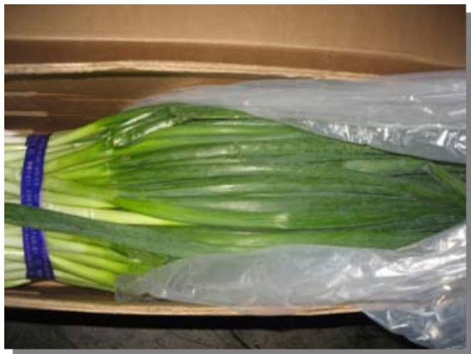
生鮮青ネギ(テブフェノジド)