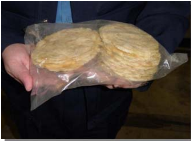
調味乾燥コチ(二酸化硫黄)