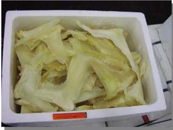
乾燥フカヒレ(過酸化水素)