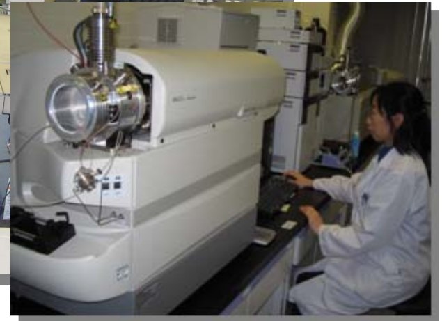
高速液体クロマトグラフ質量分析計