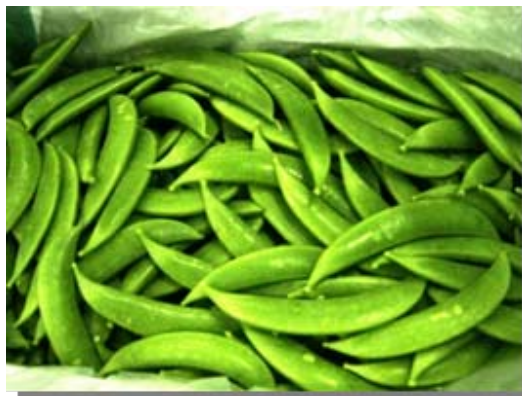
生鮮スナップエンドウ (フルシラゾール)