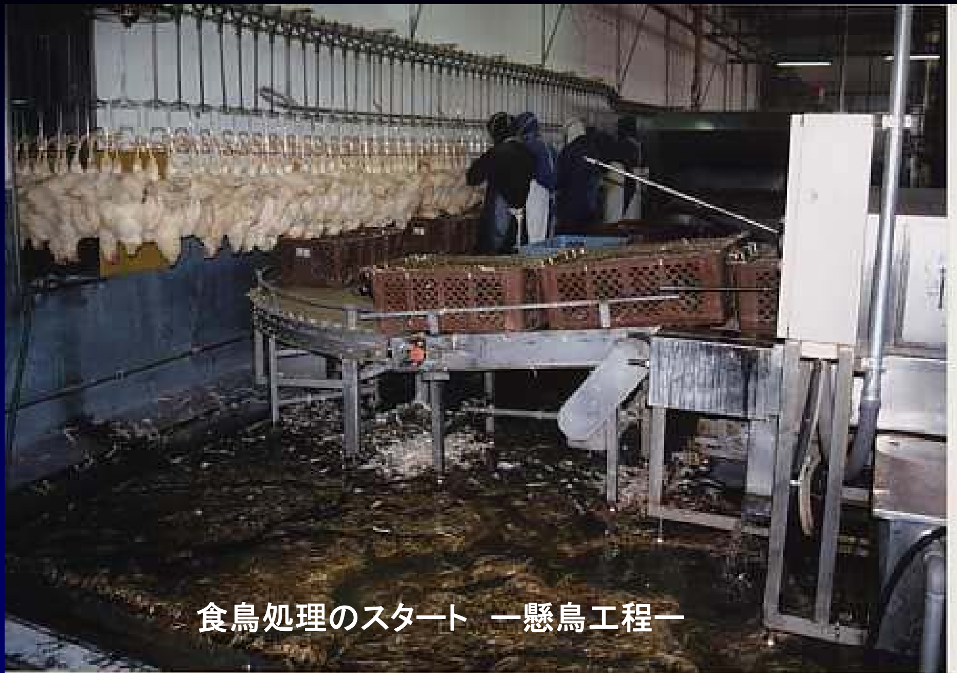
食鳥処理のスタート —懸鳥工程—