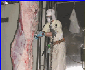
せき髄硬膜を入念に除去