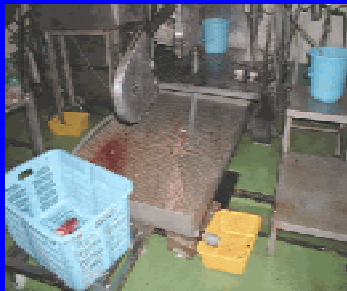
背割り鋸屑の回収スクリーン