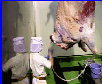
せき髄の吸引除去