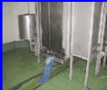
枝肉洗浄水から鋸屑片を回収