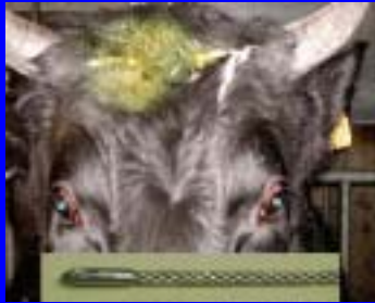
一部のと畜場でのピッシングの使用中止