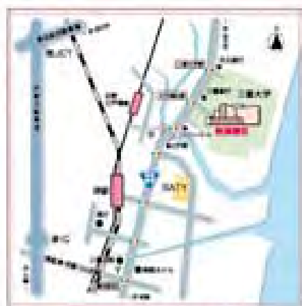
三重大学医学部附属病院周辺マップ