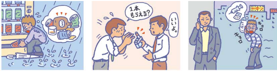
様々な薬物探索行動

ニコチンには、精神依存を引き起こす強い作用がありますが、身体依存を引き起こす作用は実際にはないと考えられています。喫煙者は、たばこが切れると、時刻、天候にかかわらず、労をいとわず買いに行きます(薬物探索行動)。職場では、喫煙者どうしで「1本もらえる?」と供給し合います。この「1本もらえる?」という言葉は、紛れもない薬物探索行動です。この薬物探索行動は、ニコチンの場合には「1本もらえる?」ですみませんが、覚せい剤の場合には、入手するためには、「まずはお金だ!」ということになります。結局、有り金を使い果たし、その後は、家族、友人に無心し、時にはお金ほしきの犯罪にまで及ぶことまであるわけです。