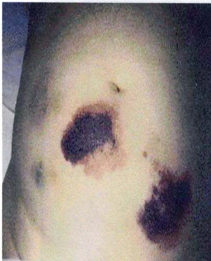
ヘパリン皮下注射部位の壊死 11)