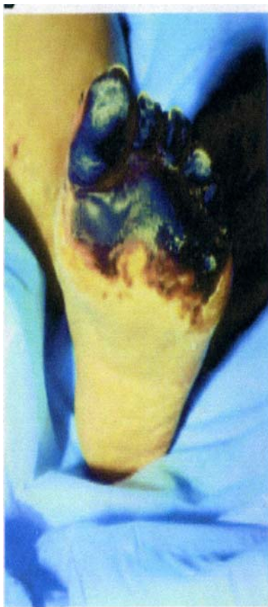
HITによる足指の壊死とヘパリン皮下注射部位の壊死 9,11)