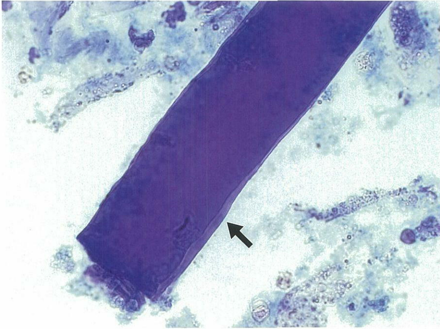
No. 4 写真