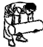
好ましくない姿勢

ロ 立位で人を抱え、身体の前方で保持する場合には、できるだけ身体の近くで支え(図 a)、腰の高さより上に持ち上げないようにする(図 b)。また、背筋を伸ばしたり、身体を後に反らしたりしないようにする(図 c)。