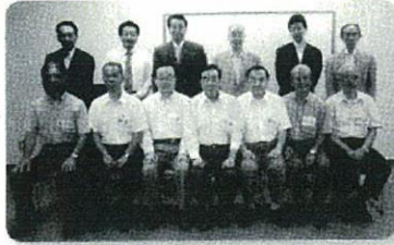
実践講座終了者(前列)と講師陣

あなたが蓄積された専門知識や培われた技術・ノウハウ(「技」)は、社会や業界が育ててくれたものでもあります。その貴重な財産を埋もらせておくのは社会の損失です。自身の「技」を意義あることに使いたいと考えている人に、その道筋・方法を専門家がガイドします。