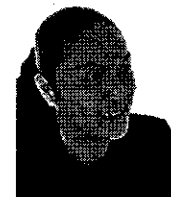
アイ・メイクのプロフェッサー

まつげエクステ511Gを研修する立役者、 都内及び都外の美容学校で講師として活躍中。 全日本美容師協会 常任顧問委員 東京美容家協会(TBA) 指導委員 講師【まつ毛エクステ・パーフェクトマスター】 (個人名義(社))