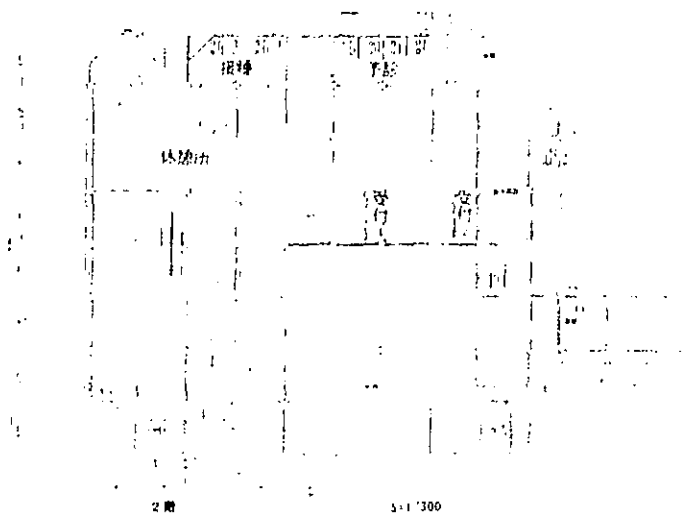
接種会場レイアウトの図面

しかし、良い場所がありました「ララ岡谷」です。駅前で、駐車場もあり、2階のフロアが丸々空いていて、広くて使える会場でした。ここは、ご存知のように商業施設が入った建物で商業組合がありません。勝手に使うわけにはいかないので、市商業観光課と協議し、商業組合にお願いし、快く了解をいただいて使用が可能となりました。また、