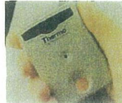
・線量計 身体が受けた被曝量を計測