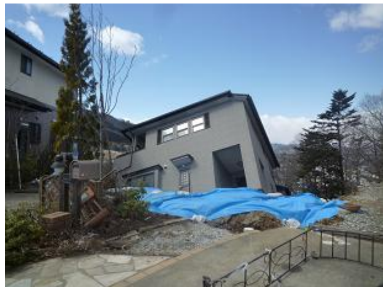
地すべりを起こした住宅地