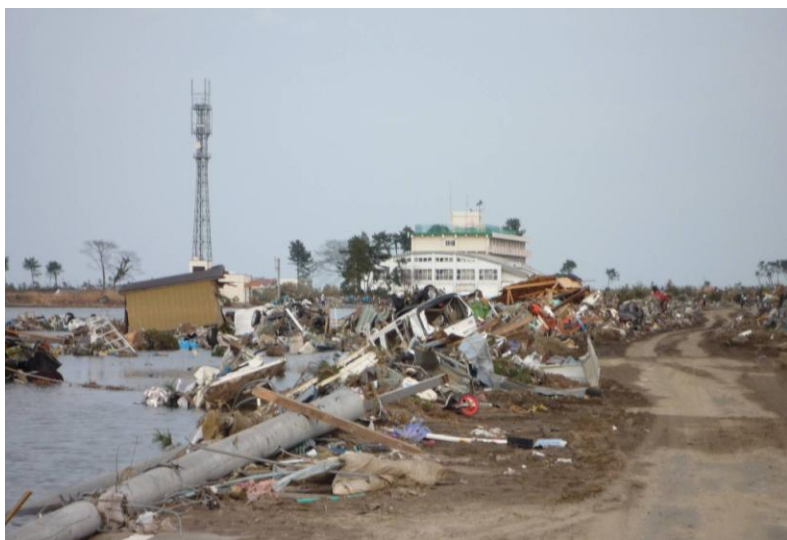
児童240人が屋上で助かった荒浜小学校