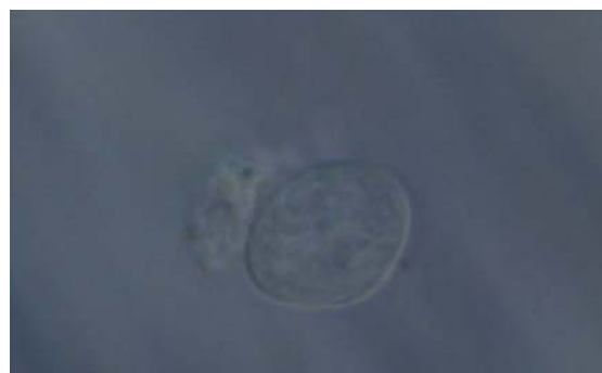
ジアルジア微分干渉像の例