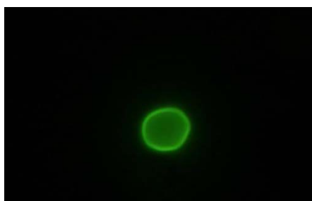
クリプトスポリジウム蛍光染色像（例 2）