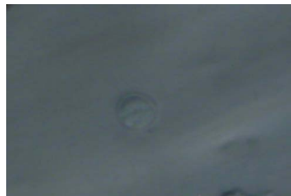
クリプトスポリジウム微分干渉像（例 2）