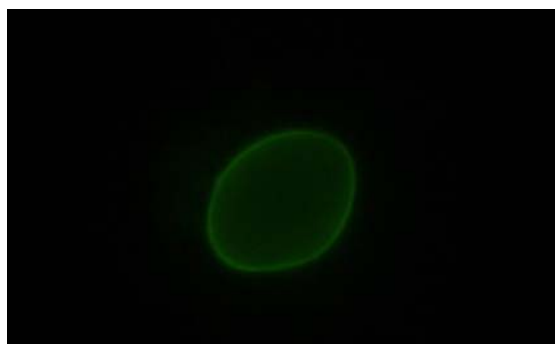
ジアルジア蛍光染色像の例