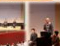
地域生活支援センターの運営に協力している。

地域生活支援センターの運営に協力している。地域生活支援センターの運営に協力している。地域生活支援センターの運営に協力している。