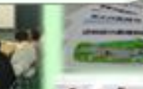
地域生活支援センターの運営に協力している。

地域生活支援センターの運営に協力している。地域生活支援センターの運営に協力している。地域生活支援センターの運営に協力している。