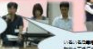
介護士協会の協力を得て、地域生活支援センターの運営に協力している。