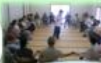
一人ひとりに対して、地域生活支援センターの運営に協力している。

地域生活支援センターの運営に協力している。地域生活支援センターの運営に協力している。地域生活支援センターの運営に協力している。