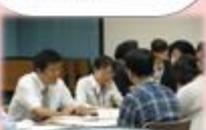
多岐にわたる「地域の課題」の解決を図っている。

地域生活に関わる課題の解決を目的として、地域生活に関わる課題の解決を目的として、多岐にわたる活動を実施した。本年度は、地域生活に関わる課題の解決を目的として、多岐にわたる活動を実施した。本年度は、地域生活に関わる課題の解決を目的として、多岐にわたる活動を実施した。