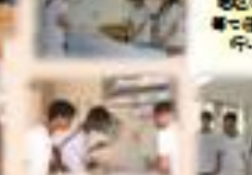
地域生活支援センターの運営に協力している。

地域生活支援センターの運営に協力している。地域生活支援センターの運営に協力している。地域生活支援センターの運営に協力している。