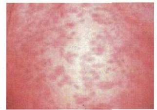
はしか(麻しん)の発しん

風しんも、発熱と全身に淡い発しんがでる感染症です。症状は、はしか(麻しん)より軽いですが、妊婦さんが妊娠初期にかかると、おなかの中の赤ちゃんが感染し、心臓の病気になったり、目や耳に障害を生じたりすることがあります。この病気を、「先天性風しん症候群」と言います。