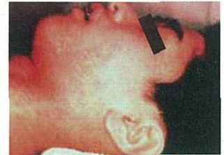
成人のはしか(麻しん)患者