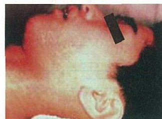
成人のはしか(麻しん)患者