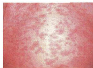
はしか(麻しん)の発しん

風しんも、発熱と全身に淡い発しんがでる感染症です。症状は、はしか(麻しん)より軽いですが、妊婦さんが妊娠初期にかかると、おなかの中の赤ちゃんが感染し、心臓の病気になったり、目や耳に障害を生じたりすることがあります。この病気を、「先天性風しん症候群」と言います。