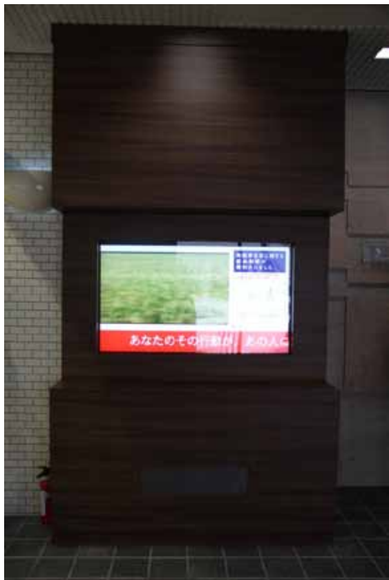
(例:秋田県赤十字血液センター)