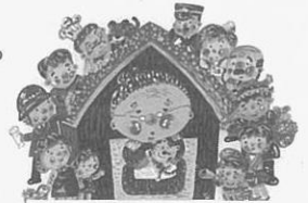
安心生活創造事業 イメージイラスト

※豊中市在住、75歳以上のひとり暮らしで、介護保険の要介護認定の申請をしていない方が対象です。