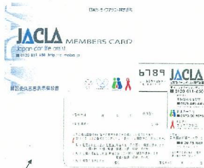
JACLA CARDの意思表示欄の改訂

「JACLAメンバーズカード」には、 臓器提供意思表示欄を設置・配布。 各教習所には意思表示カード付きリーフレットを設置。