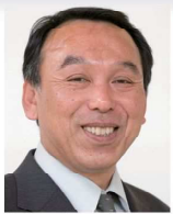
高知県馬路村農業協同組合 代表理事組合長