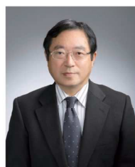
慶応義塾大学商学部 教授