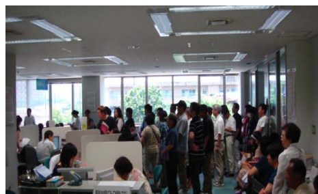
雇用保険給付窓口の様子 (ハローワーク福島)

(平成21年度より暫定措置として実施)の個別延長給付(原則60日分)に加え、更に60日分延長する特例措置を実施し、生活の安定を図ることにした。(この措置により、震災離職者は最短でも10月中旬まで雇用保険の失業給付を受けられるようになった。)