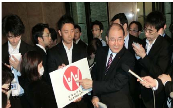
<シンボルマークを公表する細川厚生 労働大臣(当時)>

「日本はひとつ」しごとプロジェクトの取組が広く被災地に周知され、必要な支援が必要とする方に届くようにする必要があるが、当面の間は、通常の情報ツール(新聞、インターネット等)に期待するのは困難なため、4月に政府広報壁新聞に被災地の雇用創出事業などを掲載し、合計2,000カ所の避難所のほか、コンビニ、郵便局等合計5,900カ所に配布した。