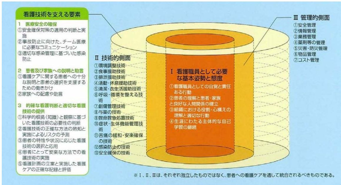
図 2 臨床実践能力の構造

看護は必要な知識、技術、態度を統合した実践的能力を、複数の患者を受け持ちながら、優先度を考慮し発揮することが求められる。そのため、臨床実践能力の構造として、I 基本姿勢と態度 II 技術的側面 III 管理的側面が考えられる（図 2）。これらの要素はそれぞれ独立したものではなく、患者への看護を通して臨床実践の場で統合されるべきものである。また、看護基礎教育で学んだことを土台にし、新人看護職員研修で臨床実践能力を積み上げていくものである。