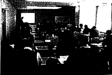
安全・安心の目印[Sマーク]説明会