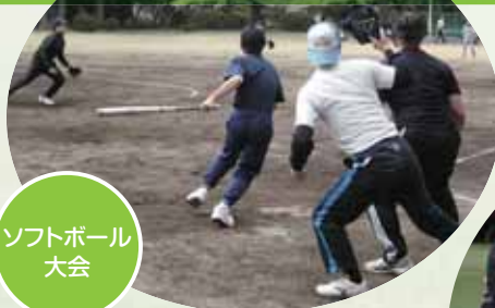
ソフトボール大会