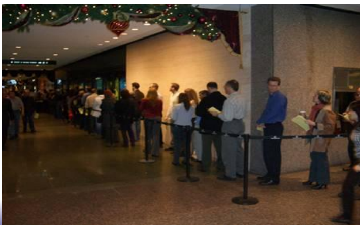
街角で... インフルエンザ ワクチンの接種