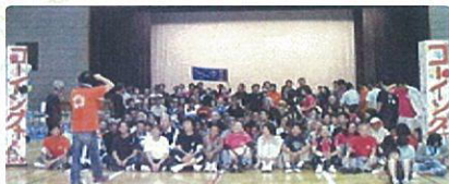
自立生活サポートセンター 自立者互助会 「なかまの会」