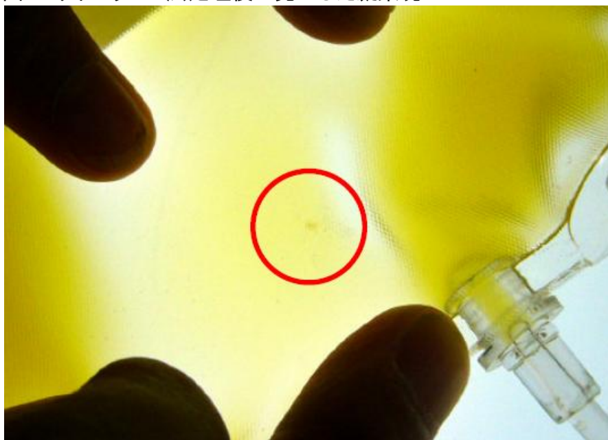
図 2 リボフラビン法処理後に発生した凝集塊