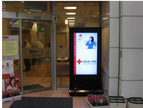
〔岡山県赤十字血液センター 表町出張所〕