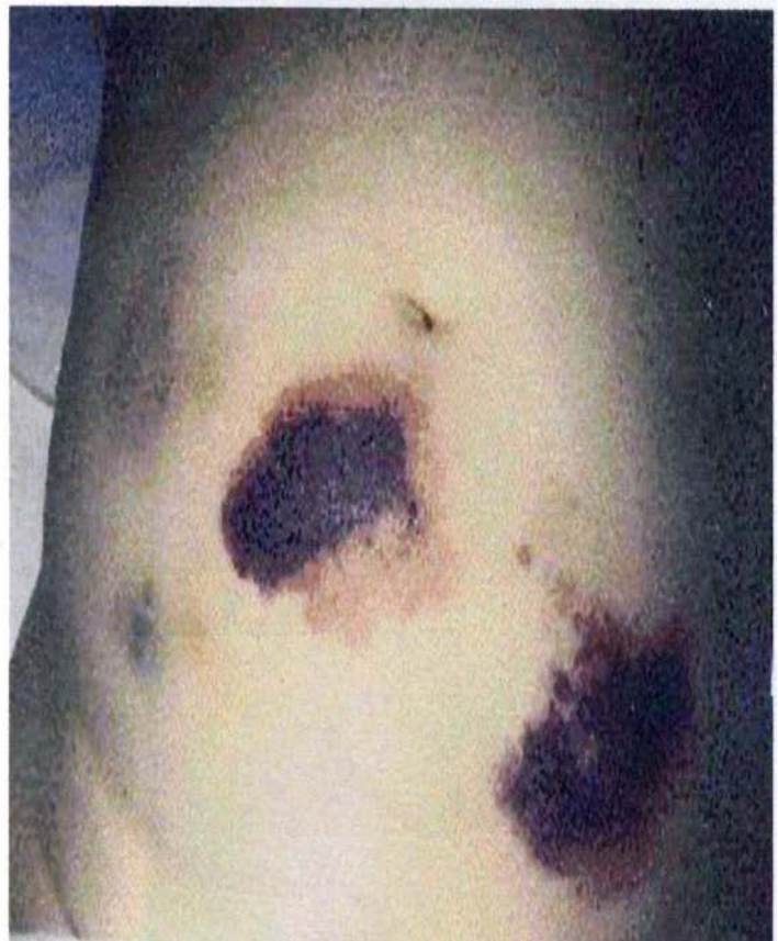
HITによる足指の壊死とヘパリン皮下注射部位の壊死 9,11)