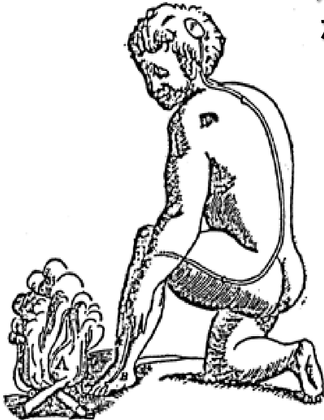
Descartes, R. (1644)

痛みとは組織の実質的あるいは潜在的な障害に結びつくか、このような障害をあらわす言葉をつかって述べられる不快な感覚・情動体験である。