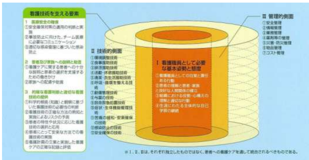
図2 臨床実践能力の構造

看護は必要な知識、技術、態度を統合した実践能力を発揮して、複数の患者を受け持ちながら、優先度を考慮し行うことが求められる。そのため、臨床実践能力の構造として、Ⅰ基本姿勢と態度 Ⅱ技術的側面 Ⅲ管理的側面を提示した（図 2）。これらの要素はそれぞれ独立したものではなく、患者への看護を通して臨床実践の場で統合されるべきものである。また、看護基礎教育で学んだことを土台にし、新人看護職員研修で臨床実践能力を積み上げていくものである。