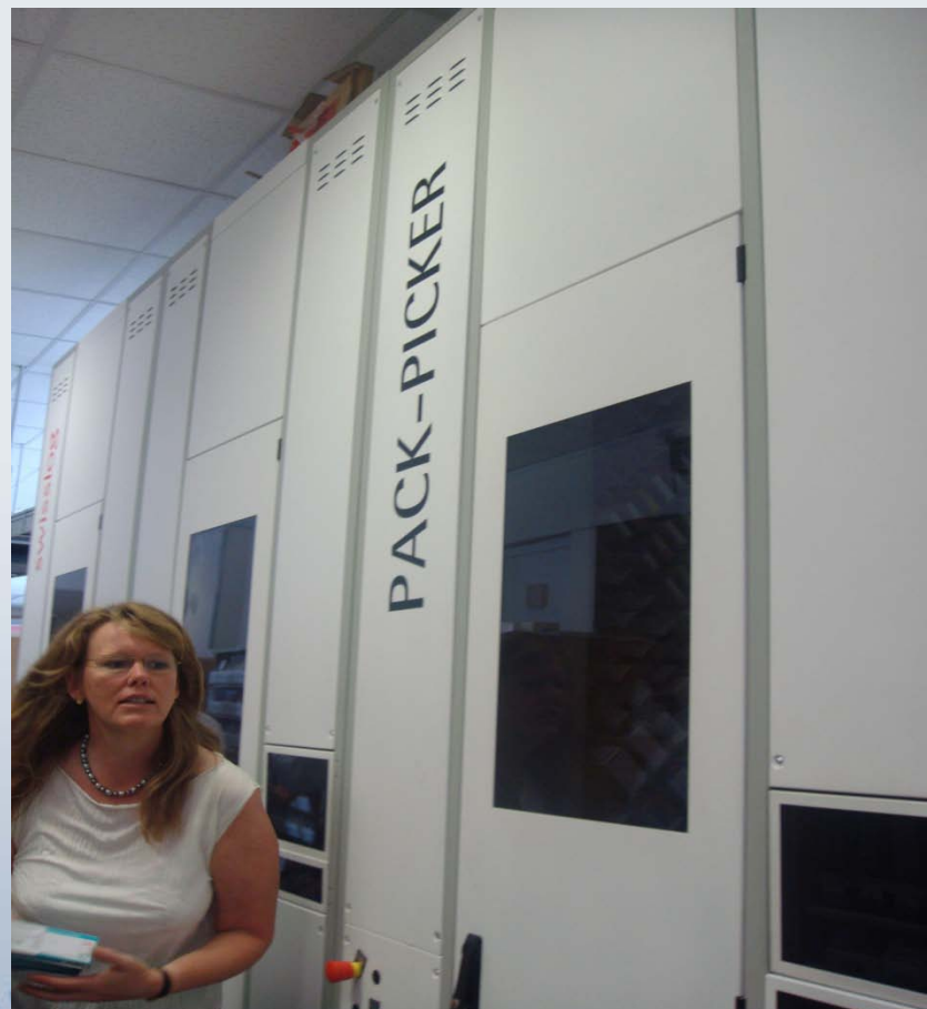
ピッキングロボット全景