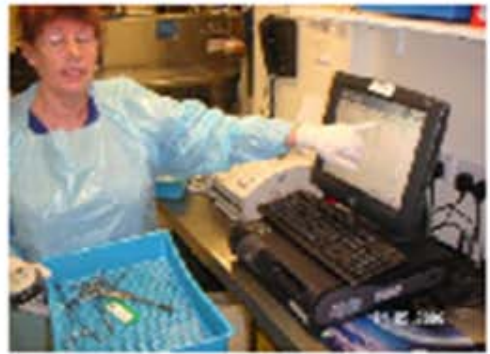
カートの移動管理 (データマトリックス読取)