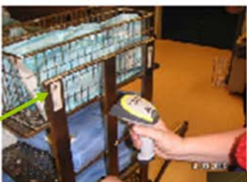
データマトリックス表示

Central Manchester Hospital + Children's University Hospital Manchester UK