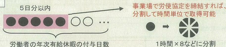
【図】時間単位年休の仕組み

(注3) 例えば、労働者が日単位で取得することを希望した場合に、使用者が時間単位に変更することはできません。